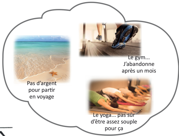
Pas d'argent pour partir en voyage