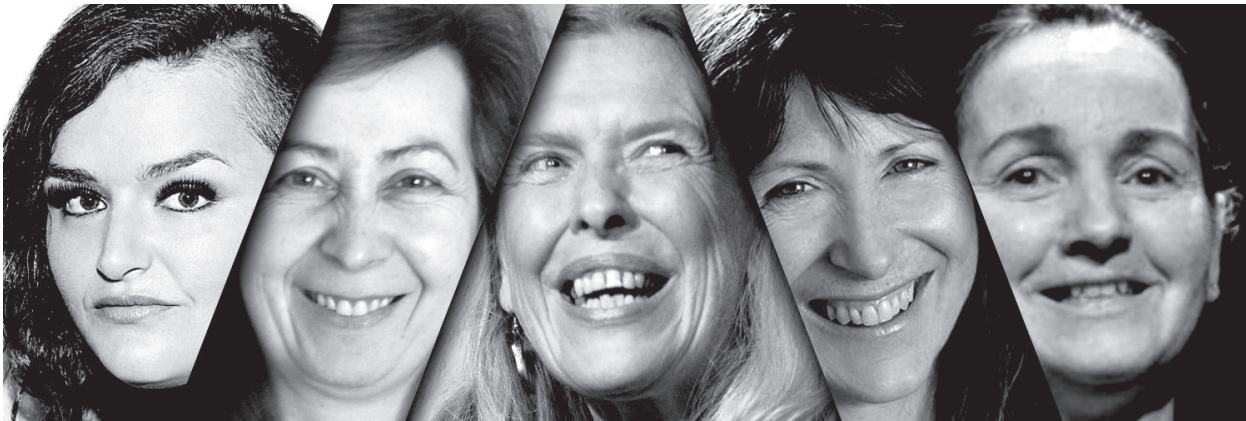
Les conteuses du spectacle Femmes fortes