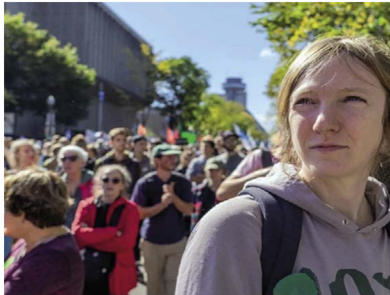
Un film sur le temps et le territoire par Maxime, Catherine, Samuel, Émilise et Sol.

«Le film donne la parole aux citoyens pour tenter de définir un projet de société fondamental venu des entrailles du peuple». Aux prises, surtout en pandémie, avec un état d'urgence permanent qui appelle à performer et à désespérer, déchirés par les écarts de richesses indécents et les pouvoirs qui tassent les petits, Catherine, en passionnée rassembleuse alors qu'on a tant tenté de la discréditer pour son excentricité, propose de prendre le temps de côtoyer le voisinage : les anciens paroissiens rassemblés par le désir de renouer , titre génialement trouvé, qui remplace la religion afin de tisser de nouveaux liens et amener des réconcilia-